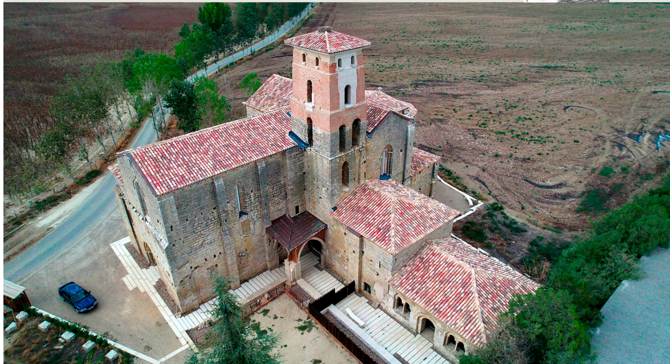
El monasterio de Santa Cruz de la Zarza es uno de los lugares más llamativos de la localidad.

Quien se acerque hasta Ribas de Campos descubre una localidad donde la cultura no es simplemente un conjunto de conocimientos plasmados en diversas formas artísticas puestas a disposición de la sociedad en su conjunto, sino un hilo conductor invisible que engloba todo tipo de manifestaciones tradicionales, junto con bienes patrimoniales e históricos de primer nivel.