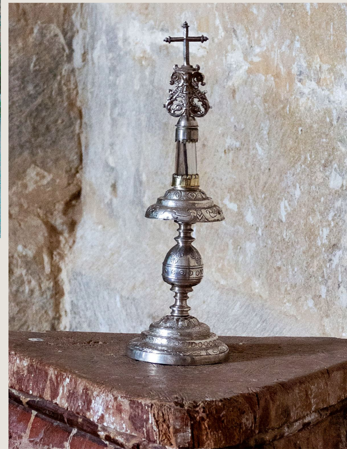
Unos defienden que esta reliquia es un trozo de la Cruz y otros sostienen que es una espina de la corona que colocaron a Jesús.