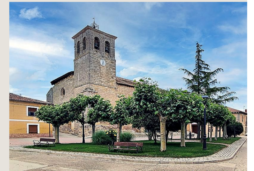
En la iglesia de San Martín se guardan las Santas Reliquias.