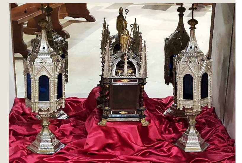
En 1204 llegaron a Ribas las reliquias de San Martín, Santiago, San Blas y San Lorenzo.