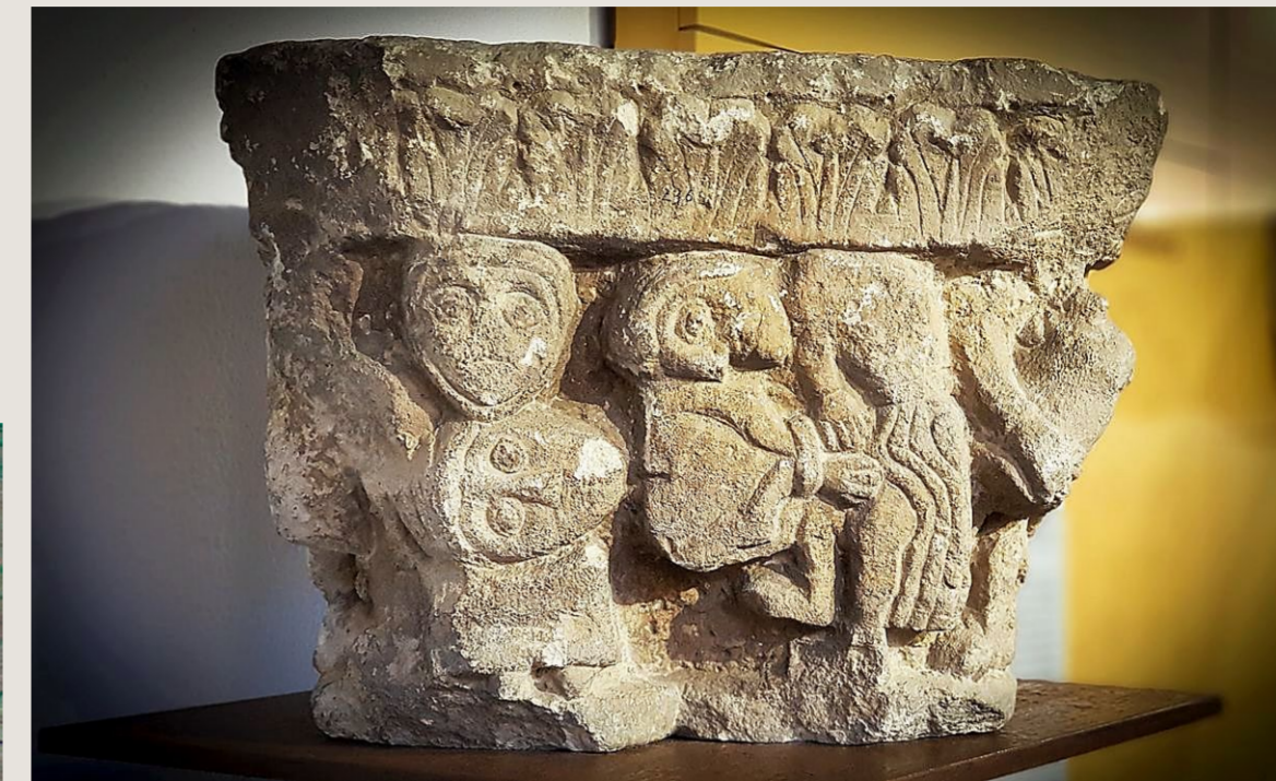
Capitel del monasterio de Santa Cruz conservado en el Museo de Palencia.

Ribas de Campos no necesita en estos tiempos levantar la voz para que sea escuchada, pues su gran patrimonio histórico-artístico, junto con las aguas del canal ilustrado que quiso navegar por la meseta castellana, y el extraordinario legado que las Santas Reliquias dejan en esta zona de Tierra de Campos... hablan por sí solos.